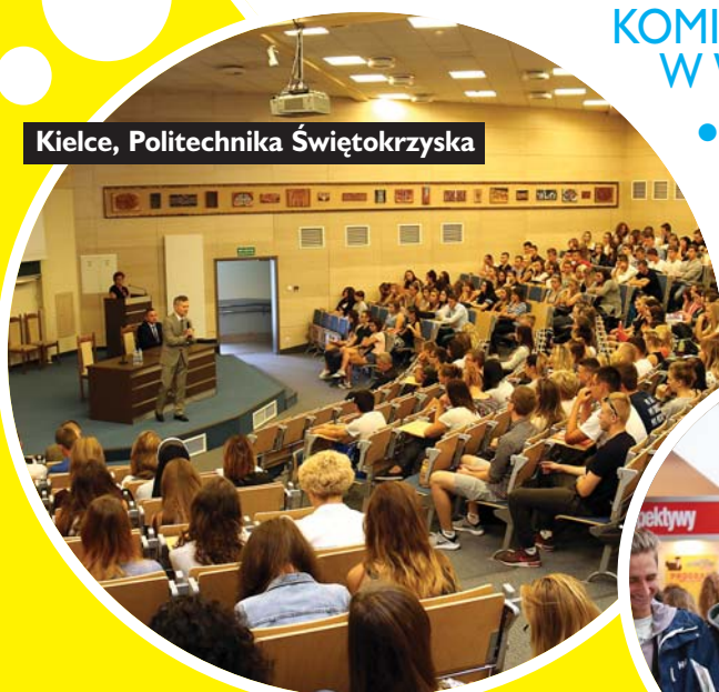
Kielce, Politechnika Świętokrzyska