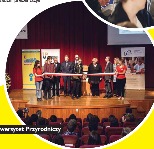
Lublin, Uniwersytet Przyrodniczy