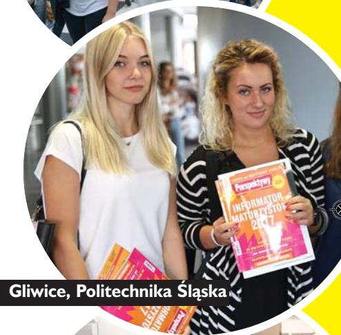
Gliwice, Politechnika Śląska