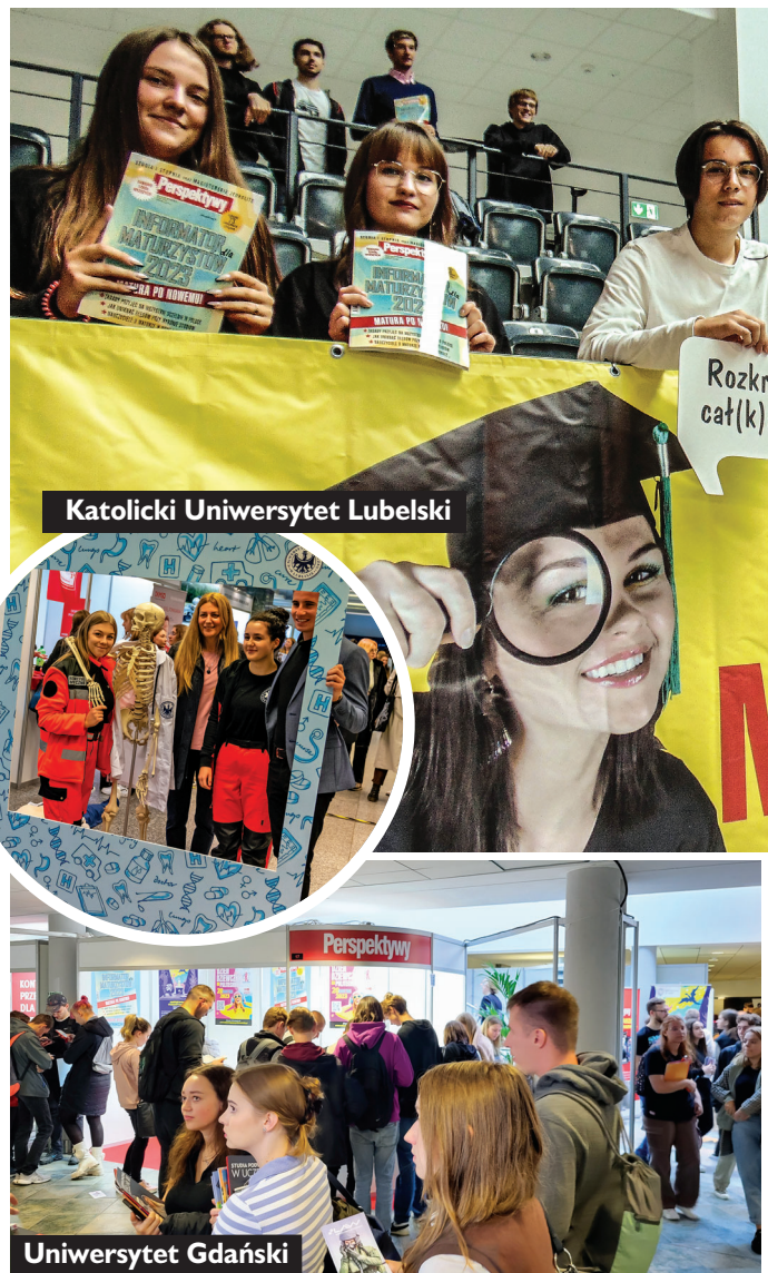
Katolicki Uniwersytet Lubelski

Uczestnicy Salonu odbiorą też od „Perspektyw” gratisowo publikację, która od ponad 30. lat pomaga kandydatom w wyborze kierunku studiów i uczelni, czyli „Informator dla Maturzystów 2024” – aktualny przewodnik na drodze od matury ku wymarzonemu studiom.