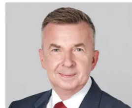
Dariusz Wiczorek Minister Nauki